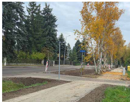
Fot. Droga rowerowa w ciągu ulicy Tarnowskiej

Jego istotnym celem jest również redukcja emisji gazów cieplarnianych, zmniejszenie liczby wypadków drogowych oraz ograniczenie nega-