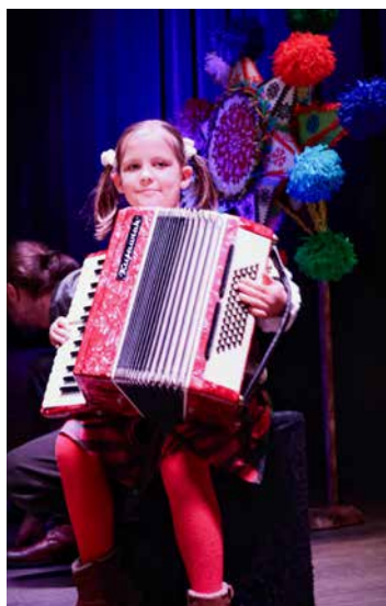
rot. Centrum Kultury Czempin