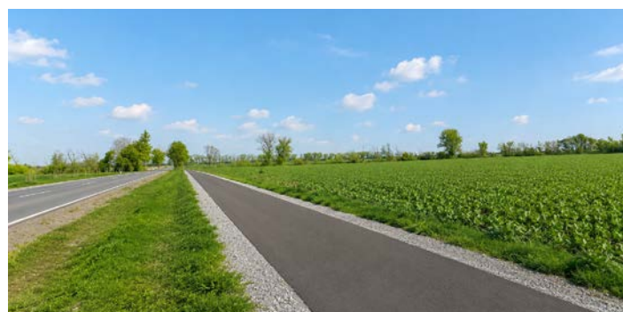
Ścieżka Piechanin - Głuchowo