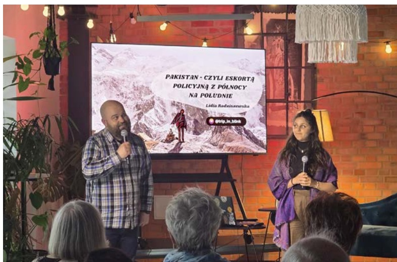
rot. Centrum Kultury Czempin

Kraj pełen kolorów. Zachwycających widoków. Z majestatycznymi szczytami Karakorum. Z niebezpiecznymi, pełnymi zakrętów górskimi drogami. Z tętniącym życiem bazarami. Z ruinami starożytnej cywilizacji doliny Indusu. Z ogromnymi meczetami, w których nawet szelest i szept rozbrzmiewają z niesamowitą siłą, bez wsparcia współczesnej technologii. Z policyjnymi eskortami (których powód jest trudny do odgadnięcia), towarzyszącymi podróżniczce przez dużą część wyprawy. A przede wszystkim z bardzo gościnnymi i pomocnymi ludźmi, którzy sprawili, że ta