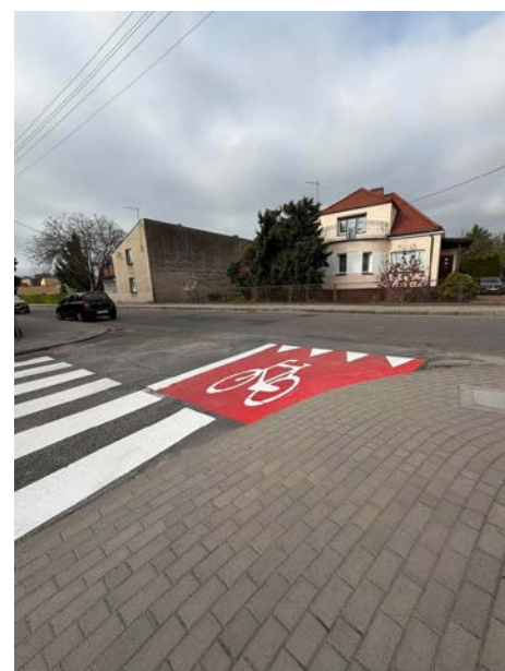
Ul. Powstańców Wlkp.