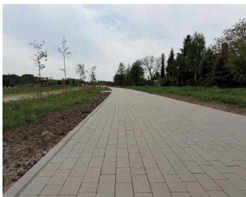
Rowerowa obwodnica miasta