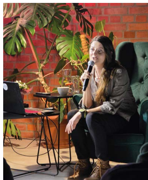
rot. Centrum Kultury Czempin

wiedziała nam o swojej samotnej, długodystansowej wyprawie na drugim końcu świata, z lekkością dziecięcej przygody na placu zabaw. Tymczasem fakty są zdumiewające: Nowa Zelandia, ponad 3 tysiące (tak, tysiące!) kilometrów szlaku Te Araroa, prawie 5 miesięcy nieustannego, samotnego marszu przez plaże, łąki, pola, lasy, obszary wulkaniczne, doliny, góry, rzeki, miasta i drogi asfaltowe. W obliczu obcej kultury i natury. Z całym bagażem stale na własnych barkach i precyzyjnym planem na ile wystarczyć wody i jedzenia... A podobno ZALEDWIE zdmuchnęła kurz z własnych marzeń i postanowiła swoje życie przeżyć, a nie tylko przetrwać! KaHo